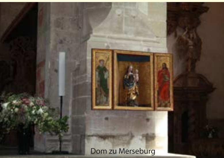
Dom zu Merseburg