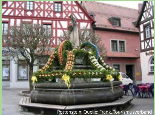
Pottenstein