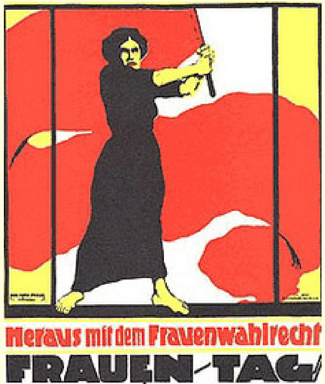
Historisches Plakat: Aufruf zum Frauentag 1914

Der Deutsche Evangelische Frauenbund, der sich seit seiner Gründung 1899 als erster und lange Zeit einziger Verband innerhalb der evangelischen Kirche zur Frauenbewegung bekannte, hat bezüglich des Frauenwahlrechts immer eine sehr eigenständige und bis heute nicht ganz leicht nachzuvollziehende Position eingenommen, die in seiner Mitgliederstruktur zu suchen ist. Im Gegensatz zur allgemeinen bürgerlichen Frauenbewegung unterschied er zwischen jenem in der kirchlichen und kommunalen Gemeinde und jenem auf