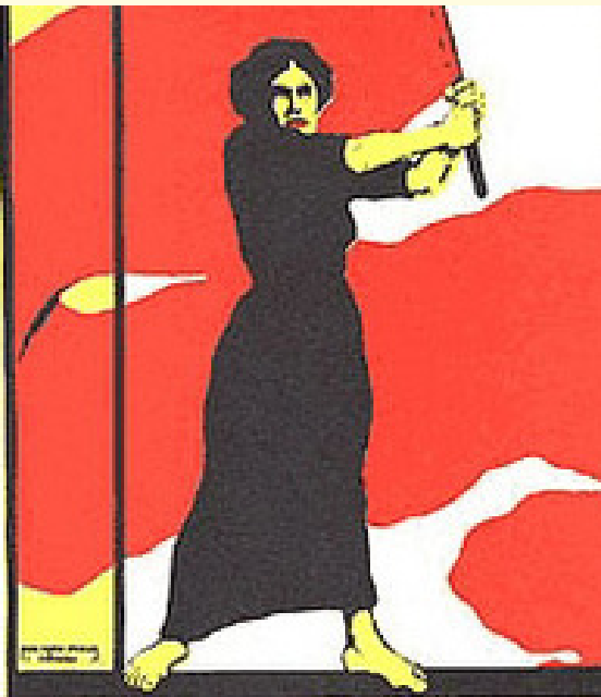
Historisches Plakat: Aufruf zum Frauentag 1914 (Artikel S. 6)